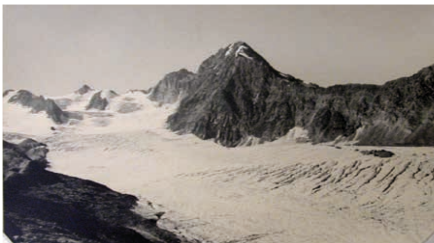
Glacier de Gebroulaz, vue depuis Méribel Mottaret, les Allues, le 22 août 1949...

Les changements climatiques affectent l'environnement et l'économie locale dans son ensemble, mais sont surtout prégnants en moyenne montagne où se concentre l'essentiel des activités économiques. Nous avons fait le choix de nous focaliser sur les domaines de l'eau, de la biodiversité et du tourisme particulièrement touchés par les évolutions climatiques futures.