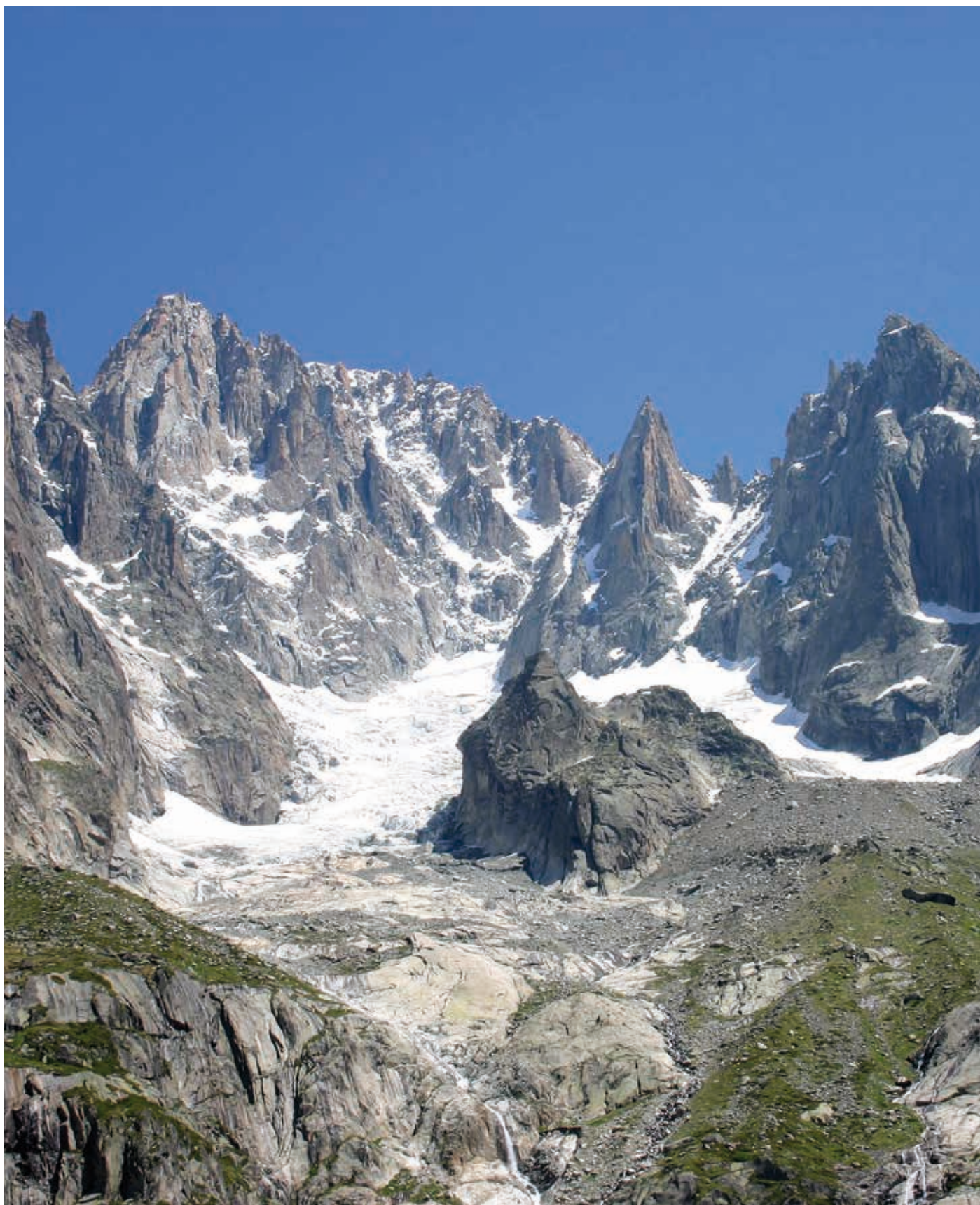
Le glacier de la Charpoua, dans le Massif du Mont-Blanc, est désormais plus difficile d'accès. Une conséquence directe des changements climatiques.