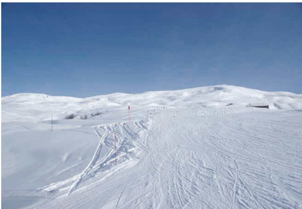
L'hiver, dans les stations, le passage des skieurs tasse le sol des zones humides.