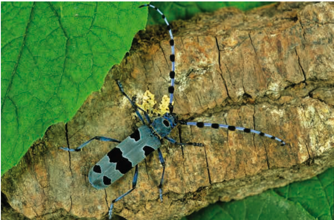
Rosalie des Alpes, Rosalia alpina . En 2007, elles sont apparues avec un mois d'avance, suite à un printemps très chaud.