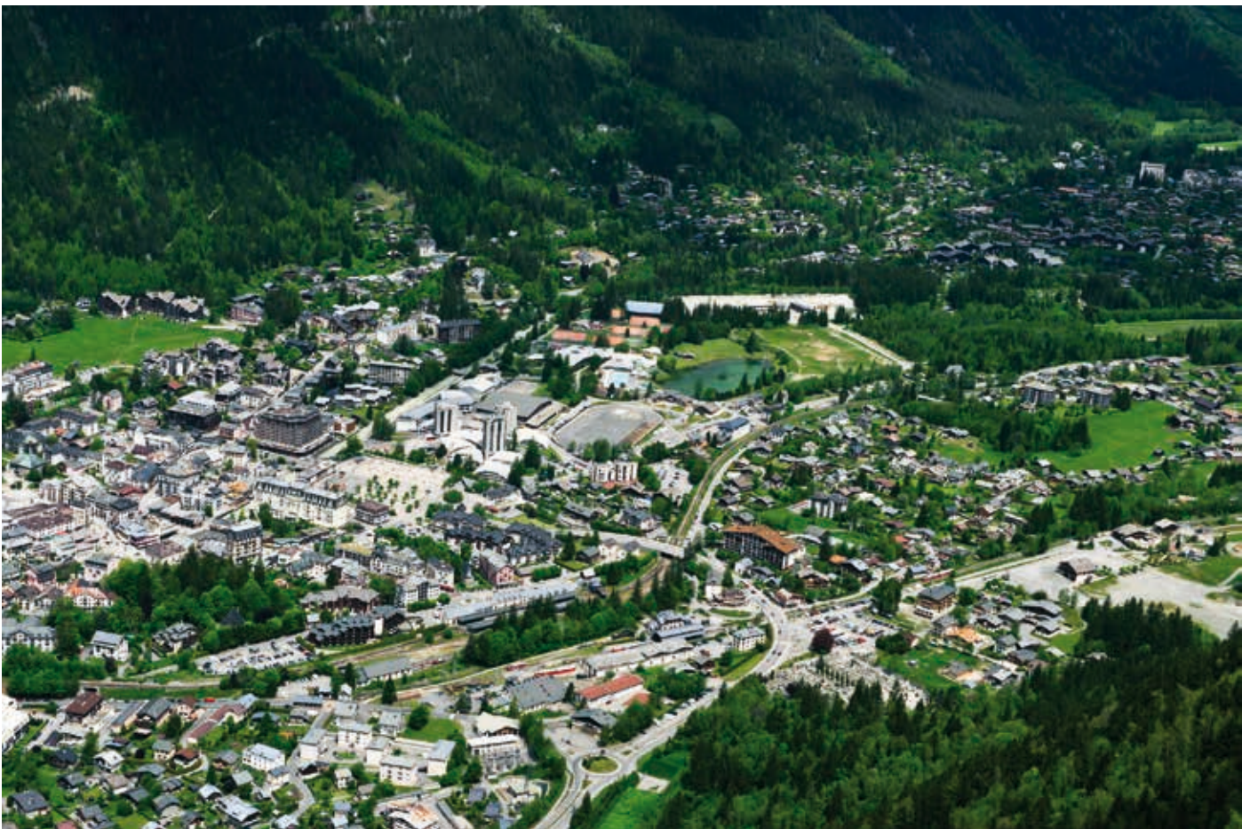
Face aux effets déjà perceptibles des changements climatiques, la communauté de communes de Chamonix a mis en place le premier plan climat énergie territorial en station de montagne.

la vallée en misant sur la valorisation équilibrée des atouts du territoire grâce à l'itinérance et à l'innovation. Rencontres (« Clubs climat ») et mises à disposition de ressources numériques pour les acteurs du tourisme, découverte interactive de la vallée de Chamonix sur smartphone ou tablette pour les marcheurs, développement de la filière gastronomique et promotion des circuits courts participent à cette transition vers tourisme plus durable.