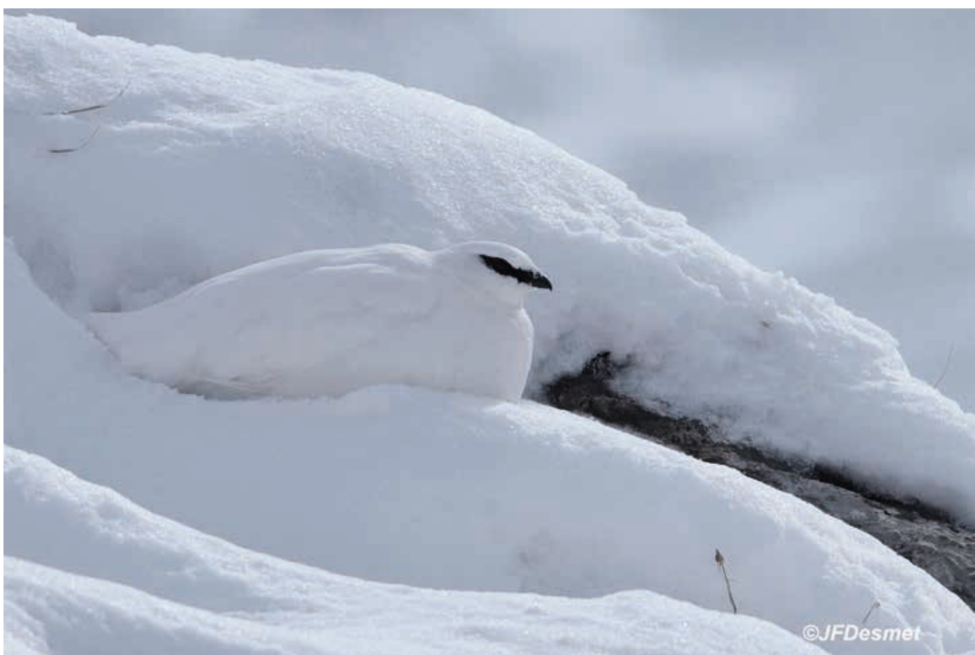
Le lagopède, comme d'autres galliformes de montagne, voit son habitat se réduire avec les changements climatiques.